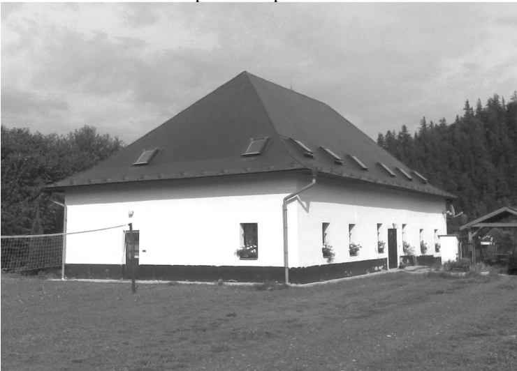
Fara v Liptovskom Jáne, v ktorej býval aj s rodičmi a sestrou