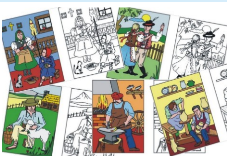
Maľovánky pre deti - Vymaľuj si Slovensko.

Vedenie NSS pri stanovovaní cieľov a plánov vychádza z reálnych možností a schopností. Neplánujeme si nereálne náročné aktivity, pre dosiahnutie ktorých je potrebné okrem nadmernej námahy