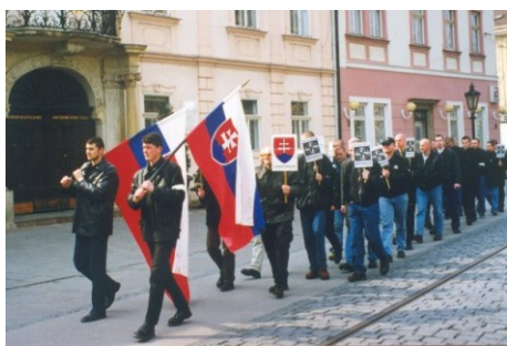
Začiatky NSS - demonstrácia proti NATO v Košiciach, 6. apríla 2002.