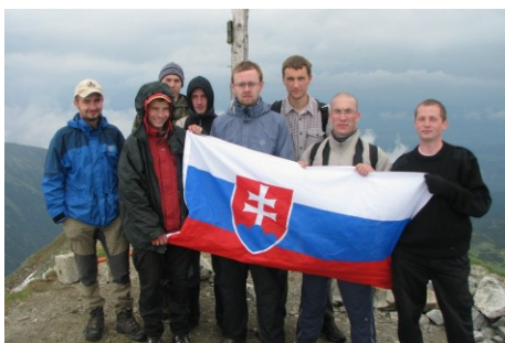
Naši členovia a naši kamaráti chodia spoločne na rôzne túry a výlety po Slovensku. Vrch Bystrá v Západných Tatrách v roku 2008.

združení a jednotlivcov v tom istom smere, atď.