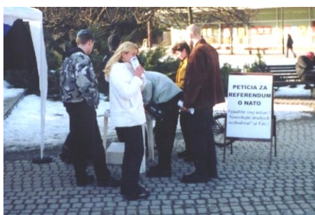
Akcia na podporu vypísania referenda o vstupe Slovenska do NATO, Žilina v roku 2003

Činnosť NSS, samozrejme, spočíva v napĺňaní programových cieľov, pričom jej konkrétnu podobu ovplyvňujú viaceré faktory, ako napríklad: aktuálne možnosti NSS, nálada v spoločnosti, činnosti iných