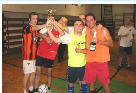
Futbalový turnaj o putovný pohár NSS.