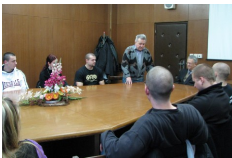
Prednáška o závislostiach organizovaná v spolupráci s Odborom mladých matičiarov v Košiciach.

zlepšovanie obrazu NSS v očiach médií, aktuálneho politického systému či zaslepanej verejnosti. V zásadných otázkach sme nekompromisní a naše ciele sú prvoradé! Ak by došlo k situácii, kedy by bolo potrebné, aby NSS ako združenie padlo pre vyššie ciele, alebo aby uvoľnilo cestu lepším, ktorí nás nahradia, sme pripravení tak urobiť. Organizácie môžu zanikať – ciele, ideály a ľudia so zápalom v srdci ostávajú.