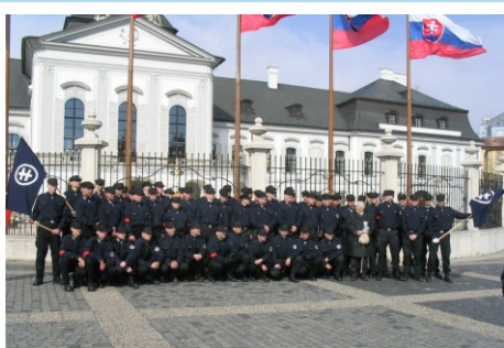
V roku 2005 sme intenzívne spolupracovali so Slovenskou pospolitosťou. 13. marca 2005 bol v Bratislave predstavený Ľudový program Slovenskej pospolitosti - Národnej strany.

Nezastávame názor, že za účelom vytvárania tzv. „národnej jednoty“ je potrebné spájanie a úzka spolupráca všetkých združení, spolkov a jednotlivcov, ktorí o sebe prehlasujú že ich cieľom je blaho národa. Ved' ak chceme spojiť prúty v pevný zväzok, musia byť tieto prúty blízko seba a najmä musia byť otočené rovnakým smerom. Násilné spájanie rozdielnych štýlov práce má za následok