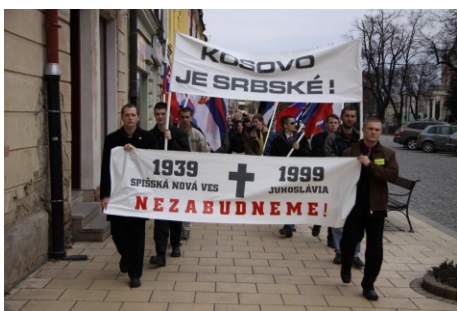
Výročie bombardovania Spišskej Novej Vsi a Juhoslávie. Už tradičná akcia v Spišskej Novej Vsi, marec 2009.

Naše aktivity sú zamerané vždy v prvom rade na dosahovanie nášho najhlavnejšieho cieľa – blaha národa. Nerobíme aktivity len preto, aby sme mohli vykazovať činnosť, aby sme mohli pravidelne aktualizovať internetovú stránku, či spisovať niekoľkostranové prehľady činností obsahujúce napríklad aj účasť jedného