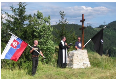
Spomienka na sv. Cyrila a sv. Metoda pri dvojkríži v Ludrovej neďaleko Ružomberku v roku 2008.

a energie aj poriadna dávka zázraku. Preto nemusíme klamať a zavádzať svojich členov a sympatizantov pri prezentovaní našich očakávaní. Pri reálnom očakávaní výsledku je priestor na sklamanie minimálny. Sklamanie a demotivácia je jed, ktorému sa treba vyhnúť. NSS si nemýli optimizmus s bludárstvom.