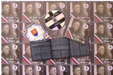
Vydali sme CD s prejavmi Dr. Jozefa Tisa.

Najvyšším rozhodovacím orgánom NSS je Snem NSS, ktorý rozhoduje o dôležitých otázkach týkajúcich sa činnosti NSS, a ktorý schvaľuje každoročný plán činnosti NSS. Medzi zasadnutiami Snemu NSS o činnosti NSS rozhoduje Rada predsedov.