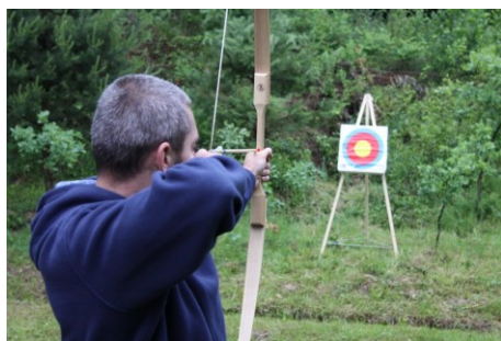
Športový víkend organizovaný kamarátmi zo Stropkova.

NSS si plne uvedomuje, že naše ciele sú natoľko náročné a vzdialené, že výsledky našich aktivít sa často prejavujú po dlhšej dobe a nie vždy sa dajú jasne definovať ako výsledok našej aktivity. Táto skutočnosť nám ale neprekáža, keďže pre nás