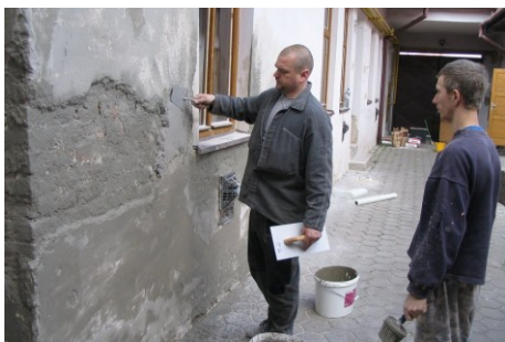
NSS sa aktívne zapája do rekonštrukcie rodného domu Dr. Jozefa Tisa v Bytči.