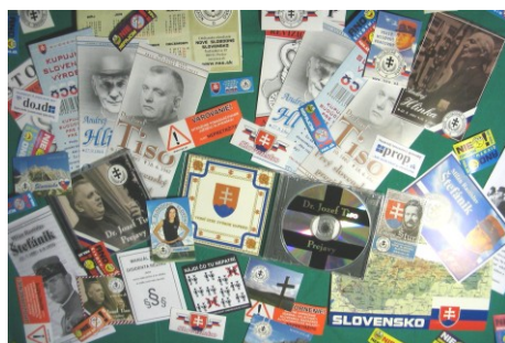
Ukážka našej vydavateľskej činnosti - plagáty, letáky, samolepky, pohľadnice, kalendáriky...

NSS na svoju prezentáciu a zviditeľňovanie nepoužíva negatívnu reklamu a vyhýbame sa zbytočnej medializácii. Za nás hovorí naša práca. Nesnažíme sa svoje združenie umelo vykresľovať iné, ako v skutočnosti je.