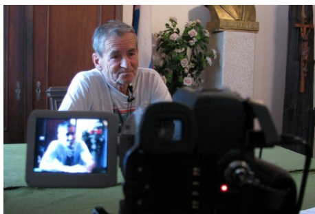
Zaznamenávame spomienky pamätníkov ktoré chceme uchovať pre ďalšie generácie.

NSS je pre členov NSS len nástroj na dosiahnutie vyšších cieľov, nie je to len náš stupeňok pre ďalšiu politickú kariéru. Preto nie sme nútení strácať svoju tvár pre